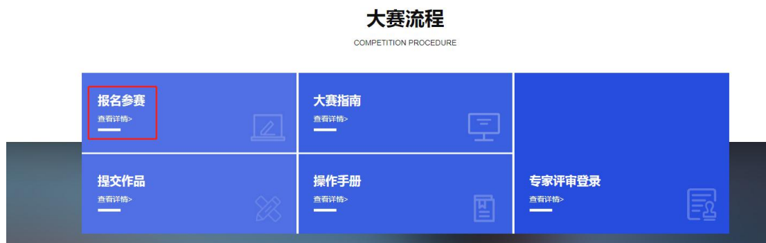
图 1 竞赛报名入口

( znjqr.zj.mooccollege.com ) 点击报名参赛，如图 1 所示