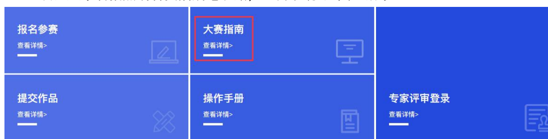
图 7 下载报名表入口